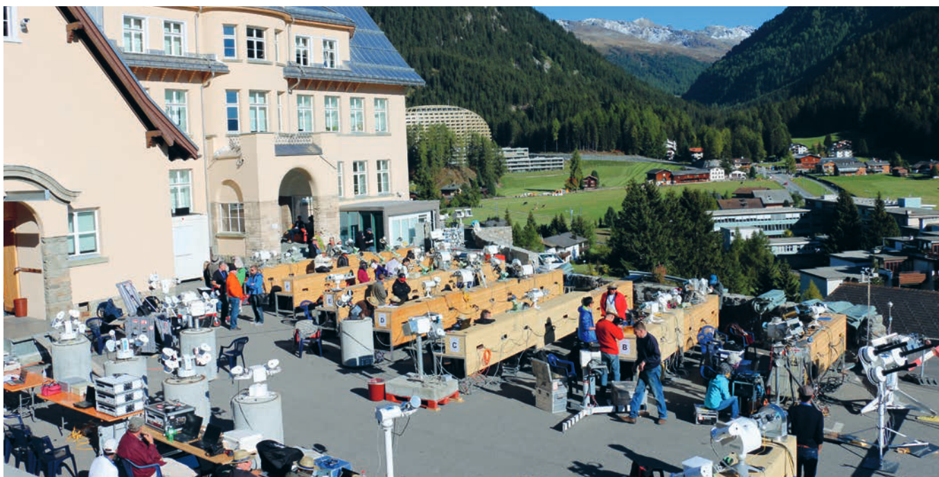
12. International Pyrheliometer Comparison in Davos, 28. September 2015.

te für Sonnen- und langwellige Infrarotstrahlung als Strahlungse- nergie pro Zeit und pro Fläche nicht so einfach im Labor verglichen werden. Diese klimarelevanten Strahlungsgrössen sind an jedem Ort der Welt verschieden. Die dazu verwendeten Messgeräte kö- nnen deshalb nur durch einen direkten Vergleich – am gleichen Ort und zur gleichen Zeit – mit den Referenzmessgeräten abgeglichen werden.